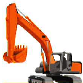
ハイブリッド油圧ショベル

国土交通省が定める燃費基準を達成した油圧ショベル・ブルドーザであること（公募要領別表1）