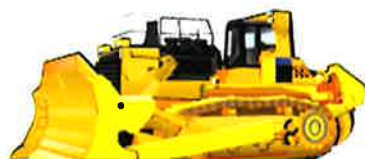
発電式ブルドーザ