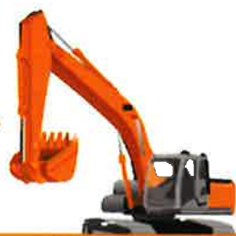
ハイブリッド・ 배터리 式・有線式油圧ショベル

国土交通省の低炭素型 建設機械の認定を受け た油圧ショベル・ブル ドーザであること