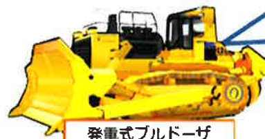
発電式ブルドーザ