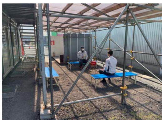
【写真④】休憩場所の工夫