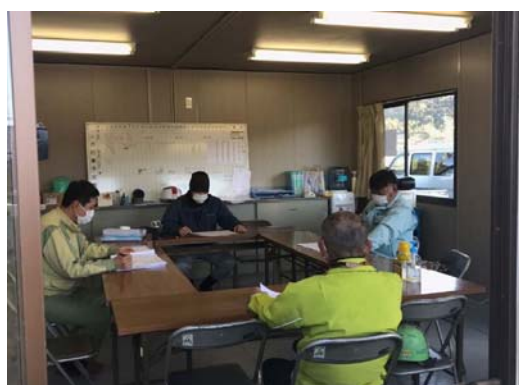
【写真④】対面距離の確保