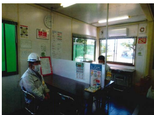
【写真⑤】パーティションによる密接防止