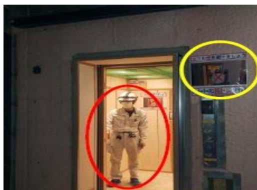
【写真⑤】昇降機の人数制限