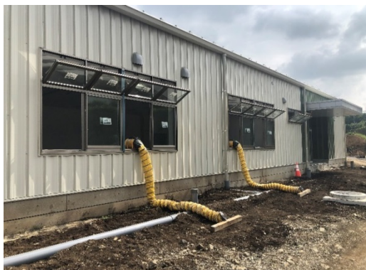
【写真②】送風機による換気(室外側)