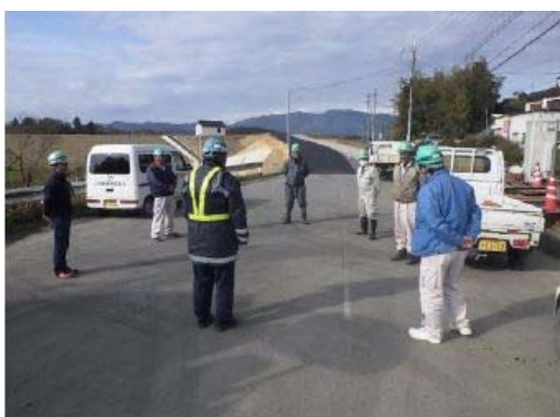
【写真④】朝礼参加人数の縮小