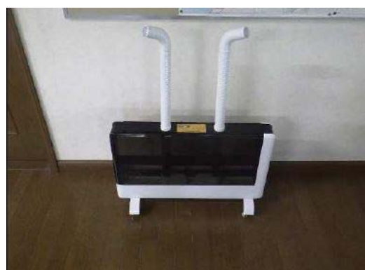
【写真⑥】次亜塩素酸水の使用