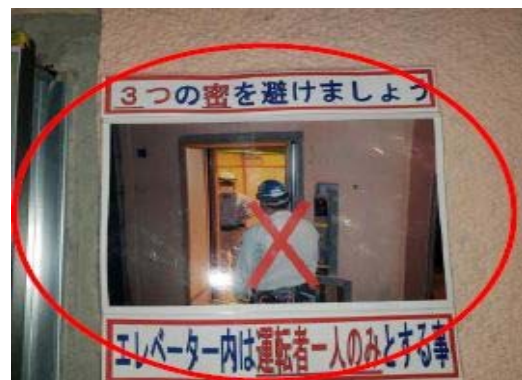
【写真⑥】昇降機利用の注意書き