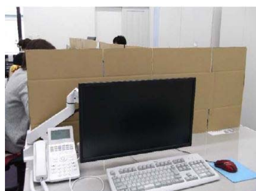
【写真⑤】パーティションによる密接防止