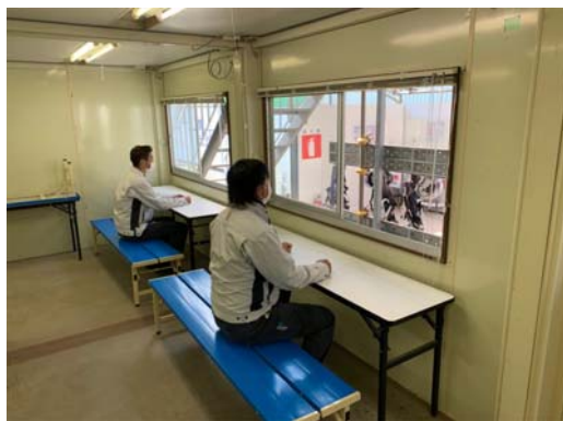
【写真②】休憩室の換気