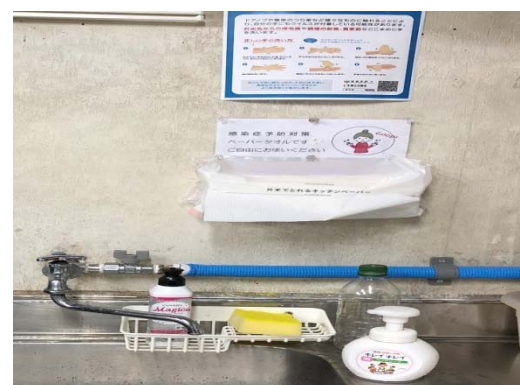
【写真⑥】ペーパータオルの利用