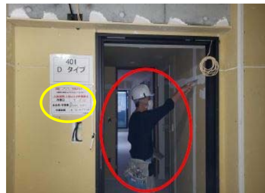
【写真③】室内作業の人数制限