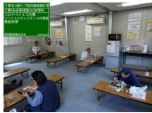
【写真③】対人間隔の確保