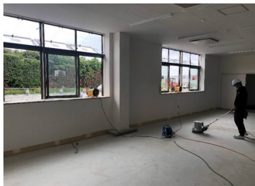
【写真①】送風機による換気(室内側)

機内は「三つの密」になり易い環境にあるため、同乗の回避を励行する。 また、厳守させるためにポスター等を掲示する。