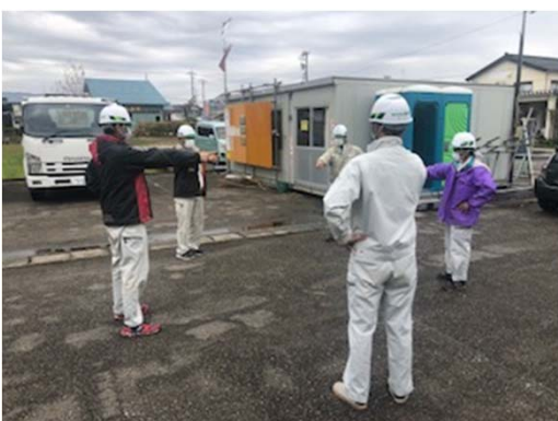
【写真⑤】指差し呼称時の距離の確保