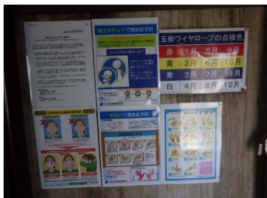
【写真①】ポスター等の掲示

ハンドドライヤーや共有タオルの使用を止め、ペーパータオルまたは個人用タオルを利用する。