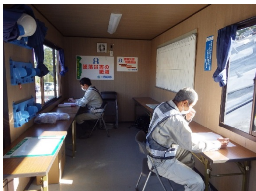
【写真②】対人間隔の確保