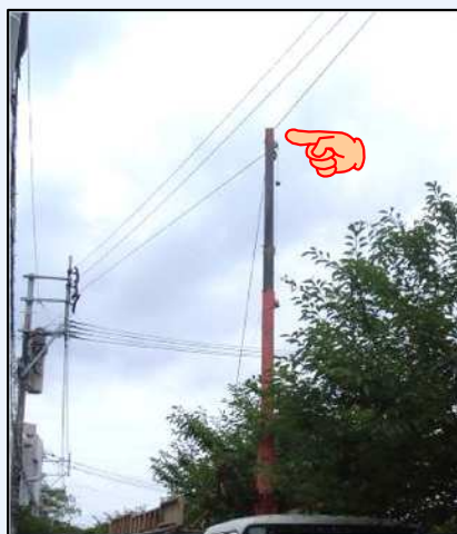
【クレーンが高圧線に接触】