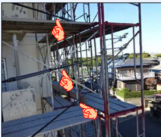
【足場が高圧線を貫通】